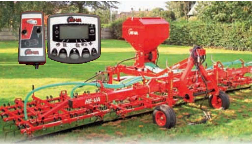
Lisävarusteena saatavana He-Va Auto-Controller elektroninen hallintalaite. Puhaltimen ja syöttökelan On/Off kytkin on traktorin hytissä.