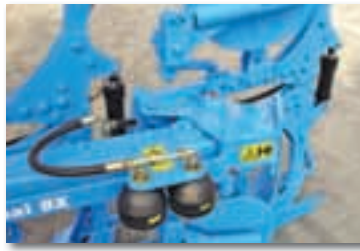
Lyömätön Optiquick työleveyden säätöjärjestelmä