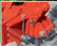
3 jousella toteutettu este-kuormitussuojaus.