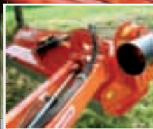
Leikkuupään sivulla sijaitseva kulmavaihte parantaa koneen liikkumavaraa.