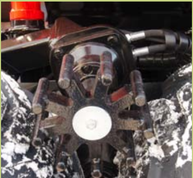
Hydraulinen 4-veto painorullalla. Rulla vapautuu automaattisesti kun vetoa ei tarvita.