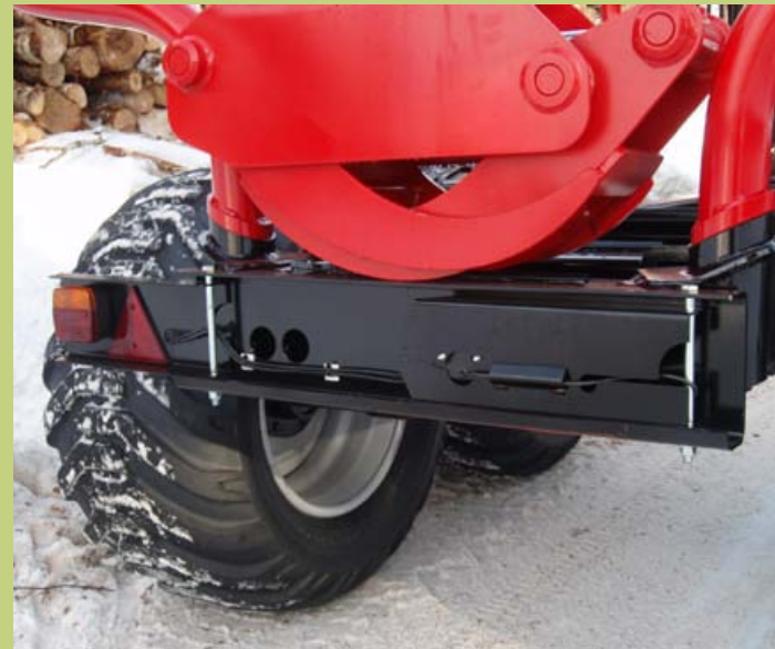
Rungonjatke ja suojatut valosarjat lisävarusteena.