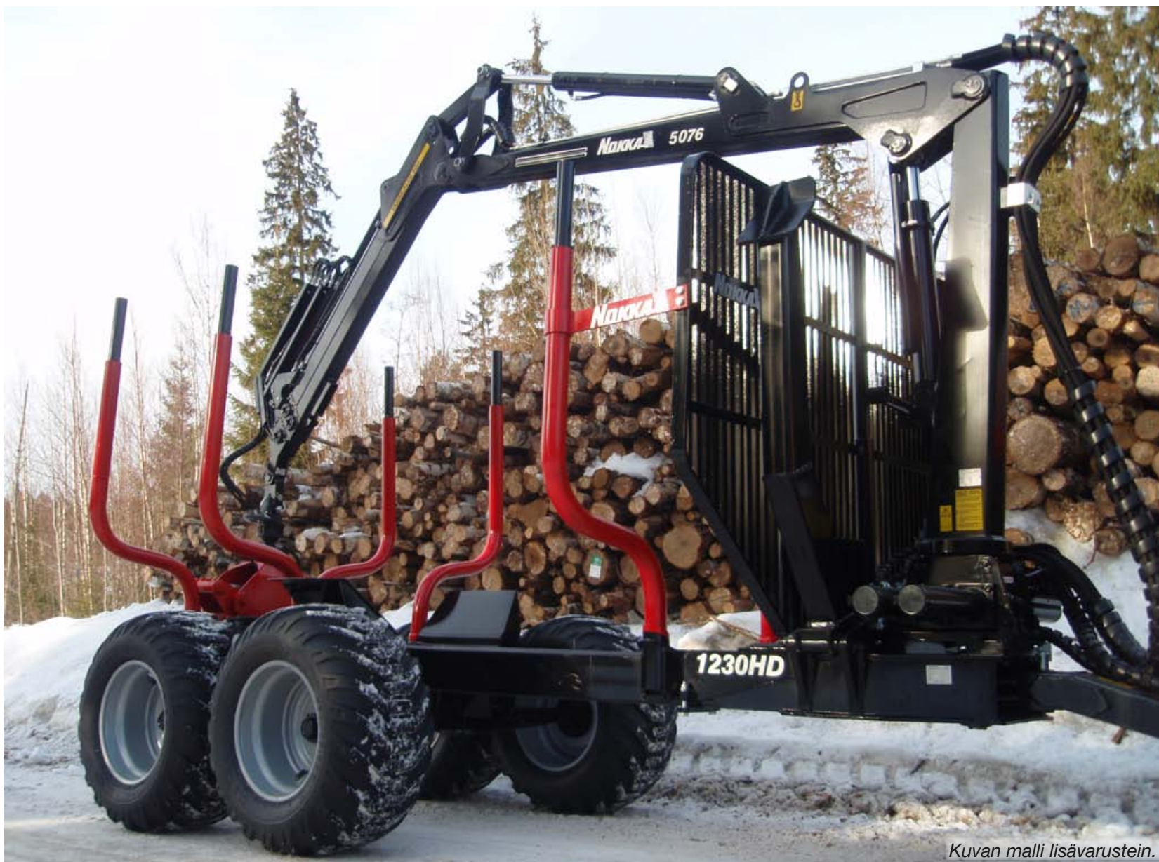
Kuvan malli lisävarustein.