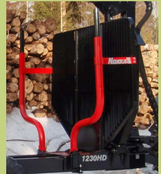
Siirrettävä etusermi/karikkapari. Hydraulinen lisävarusteena tehdastoimituksena.