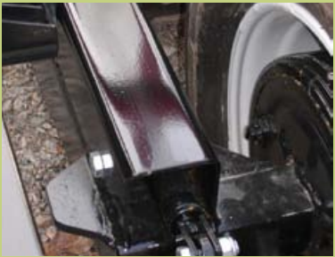
Hydrauliset jarrut 1- tai 2-akselilla lisävarusteena.