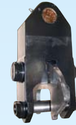
Kourajarru (NR 5) vakiona