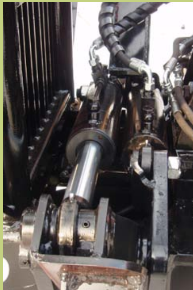
Nerokas tukijalkojen hydraulisyliintereitten rakenne.